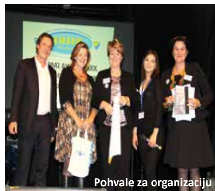
Pohvale za organizaciju