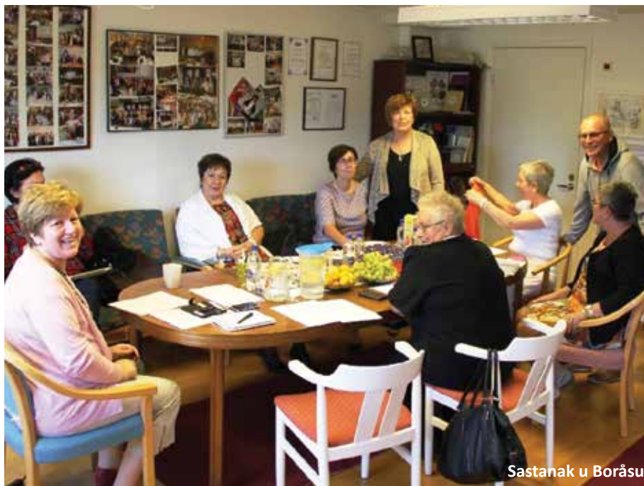
Sastanak u Boråsu

BHSSŽ je prisustvovao i rukometnoj utakmici reprezentacija Švedske i BiH odigrane u Växjö. Posjetiteljima je