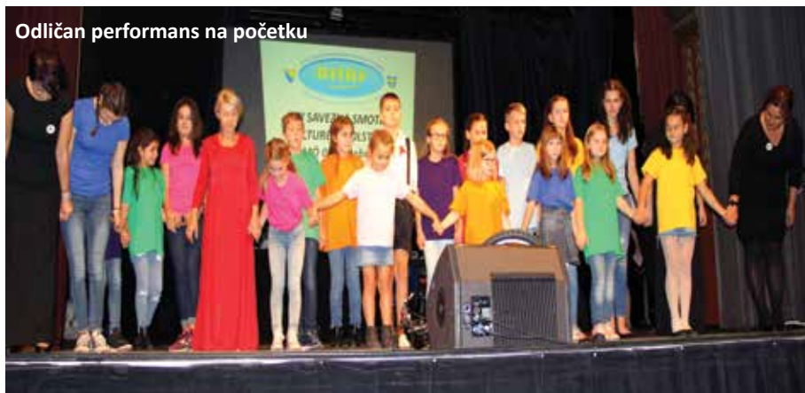
Odličan performans na početku

su uspjeli privući pažnju svih prisutnih u dvorani koji su bez daha pratili scenski nastup do samog kraja i potom glumce nagradili gromoglasnim aplauzom. U uvodnom dijelu Smotre nastupile su