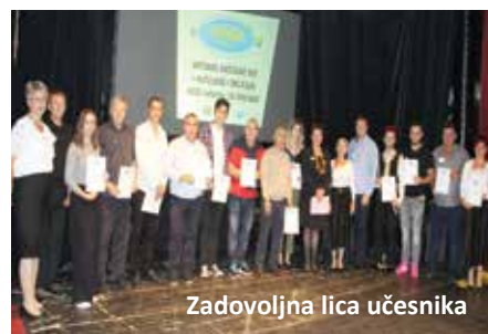
Zadovoljna lica učesnika