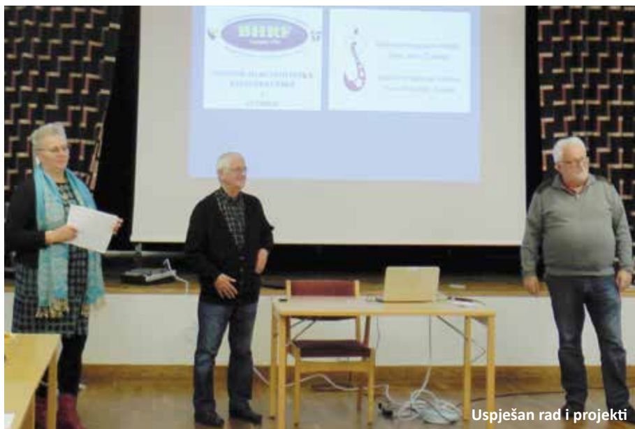
Uspješan rad i projekti