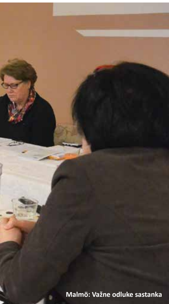
Malmö: Važne odluke sastanka