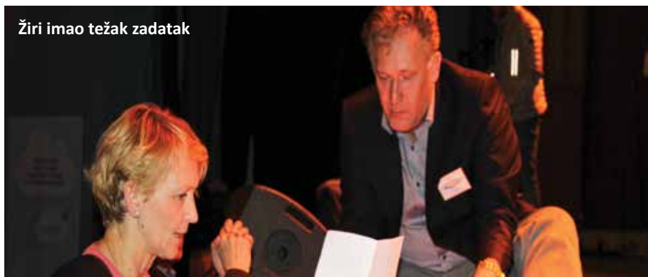
Žiri imao težak zadatak