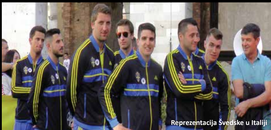
Reprezentacija Švedske u Italiji