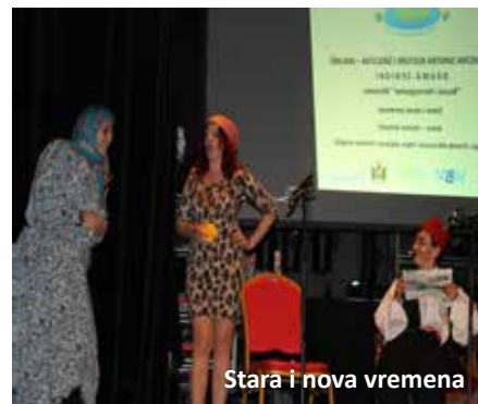
Stara i nova vremena