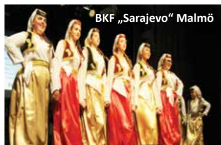
BKF „Sarajevo“ Malmö