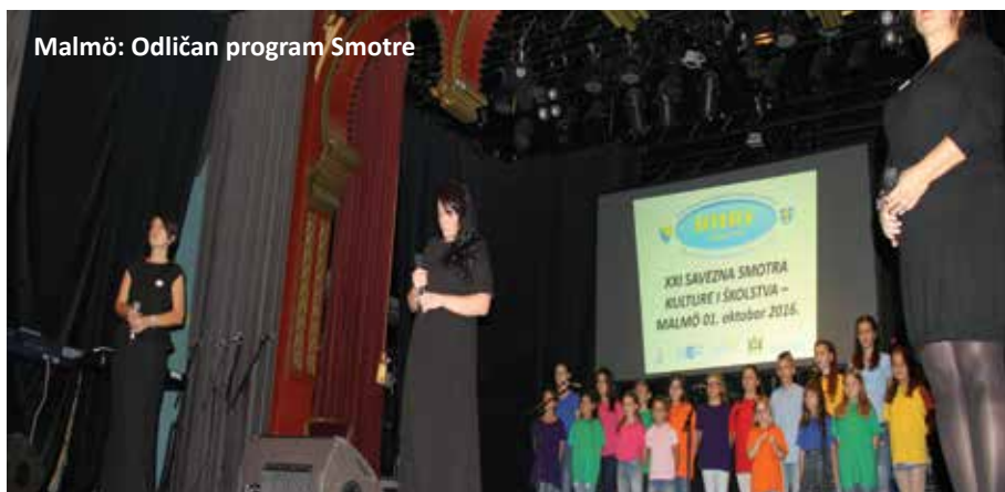
Malmö: Odličan program Smotre

Održavanjem Savezne smotre kulture i školstva u Malmö 1. oktobra ove godine ponovo je ispunjen jedan od glavnih ciljeva manifestacije – okupljanje i druženje članova i udruženja iz svih dijelova Švedske. Tokom Smotre i ovog puta je zabilježen imponozantan broj učesnika koji su nastupali u nekoliko takmičarskih kategorija i disciplina, te u revijalnom dijelu programa. Imali smo priliku vidjeti na djelu pojedince i grupe koji su stigli iz pojedinačnih udruženja – članica Saveza i predstavili svoj rad u folklornim nastupima, recitaciji i recitalu, modernom plesu, sevdalinkama, drami i monodrami, horskom pjevanju.