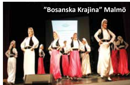
"Bosanska Krajina" Malmö